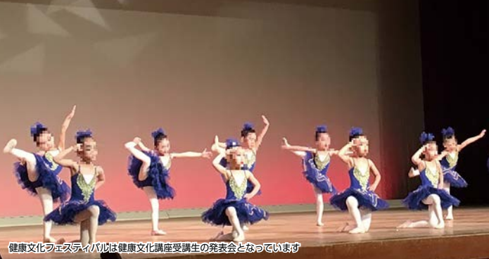
健康文化フェスティバルは健康文化講座受講生の発表会となっています

No.57、58、62、64～68、77～85、95～97は舞台発表があります！ ※2020年2月の出演講座 その他、当日は作品展示・体験会・お茶席がございます。