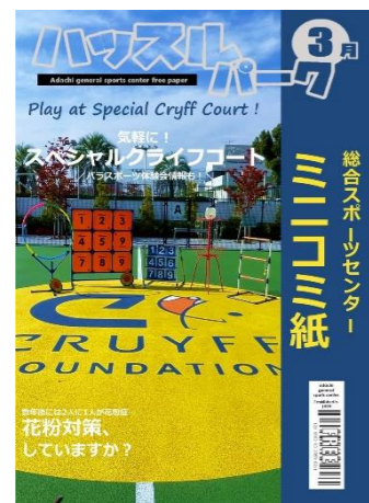
2023年3月号 スペシャルクライフコート