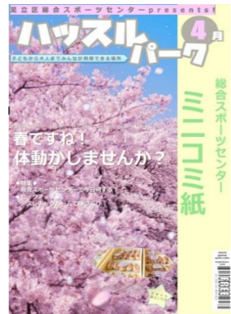
2023年4月号 総合スポーツセンターで 今日なにをする?