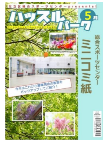
2023年5月号 募集開始の教室を ピックアップしてご紹介