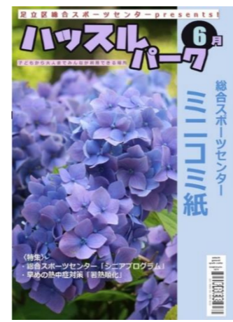
2023年6月号 ・ シニアプログラム ・ 早めの熱中症対策

ミズバ「足立総合スポーツセンター」のHPお知らせ欄では、 2019年~現在までの ハッスルパークデジタル版を掲載しています。 QRコードを読み取ってご覧ください!