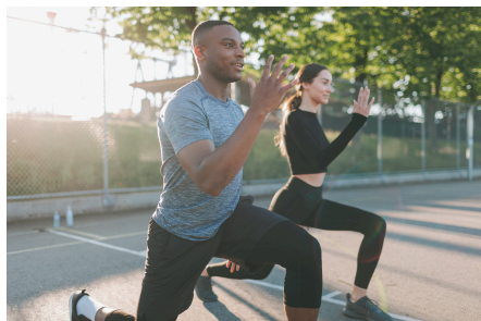
第1週目 自重トレーニング