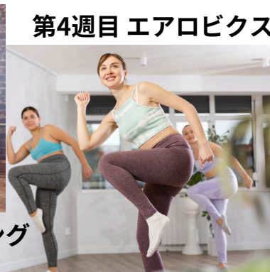
第4週目 エアロビクス

自重・体幹トレーニング、ヨガ、エアロビクスなど様々なエクササイズで身体をリフレッシュ！