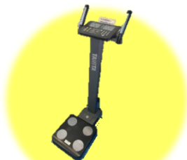
体組成測定器 (測定は裸足で行います)