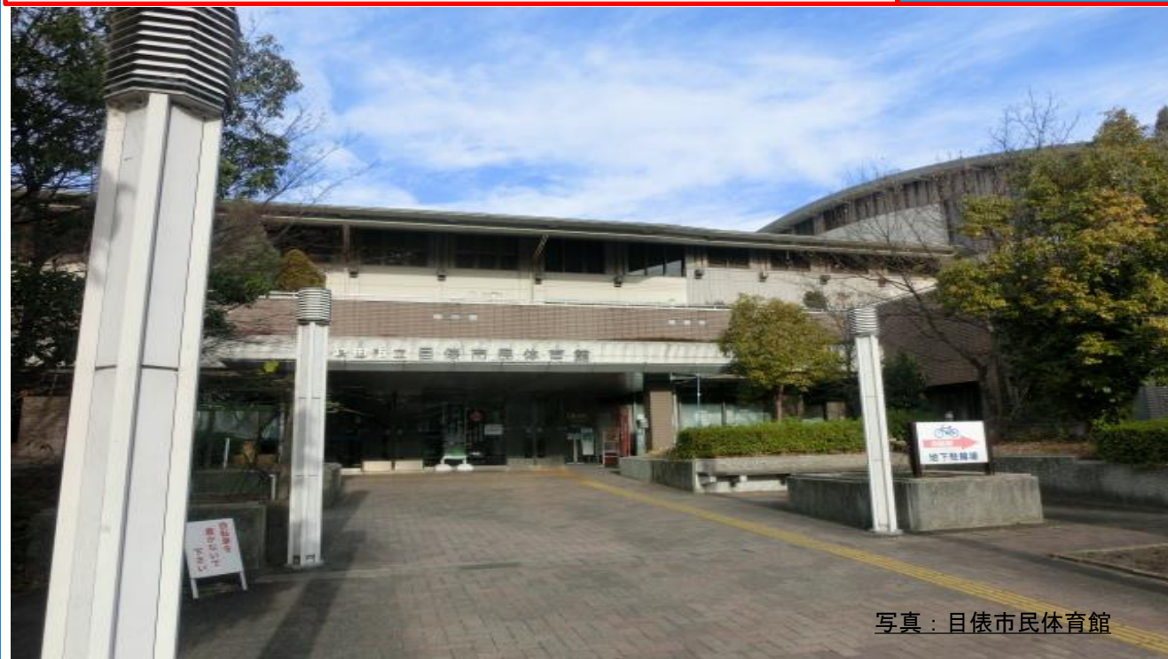
写真：目俵市民体育館