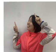
南吹田市民体育館 指導員