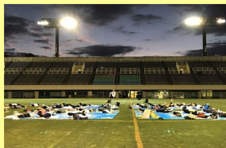
2020年 サンセットヨガ