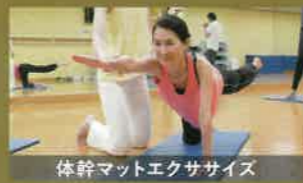
体幹マットエクササイズ