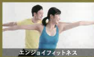
エンジョイフィットネス