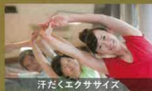
汗だくエクササイズ