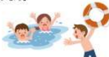
マルチスイミング説明動画