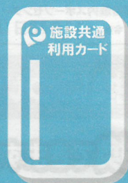
プリペイドカード