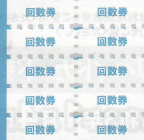
利用回数券 (10枚つづり)