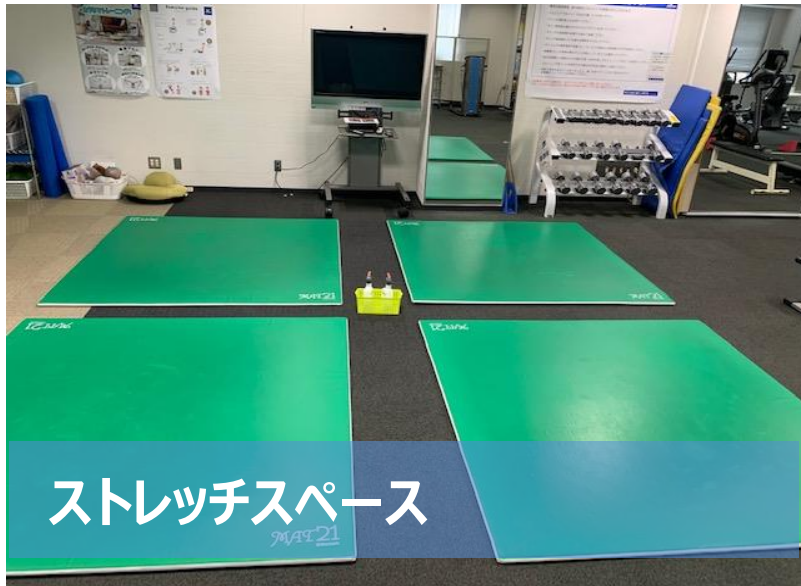
ストレッチスペース