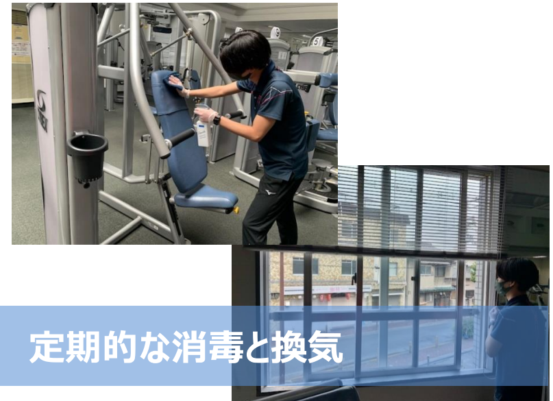
定期的な消毒と換気