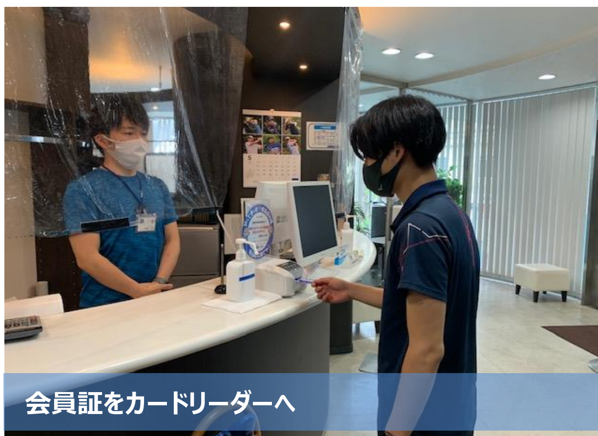
会員証をカードリーダーへ

入館時にはマスク着用の上、 体温チェック のご協力をお願いいたします。 体温については 37.5℃以上の方 は、施設のご利用を頂けませんので予めご了承下さい。 体温測定と同時に、 アルコール消毒 が可能となっております。