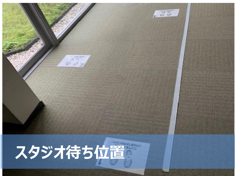
スタジオ待ち位置