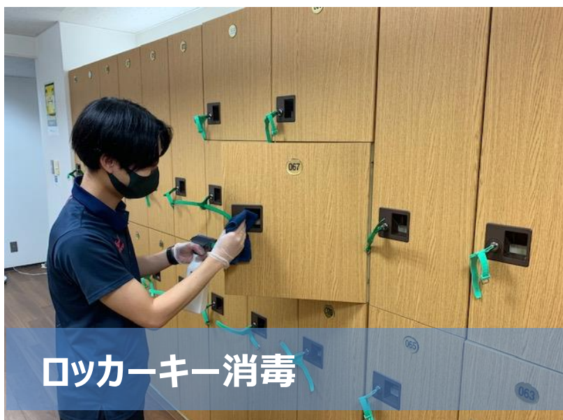
ロッカーキー消毒