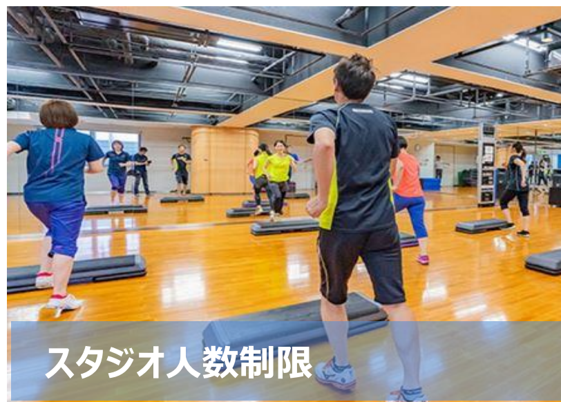
スタジオ人数制限

スタジオ 及び プールプログラムに参加される際は 、ロビーにて氏名記載をお願いいたします。