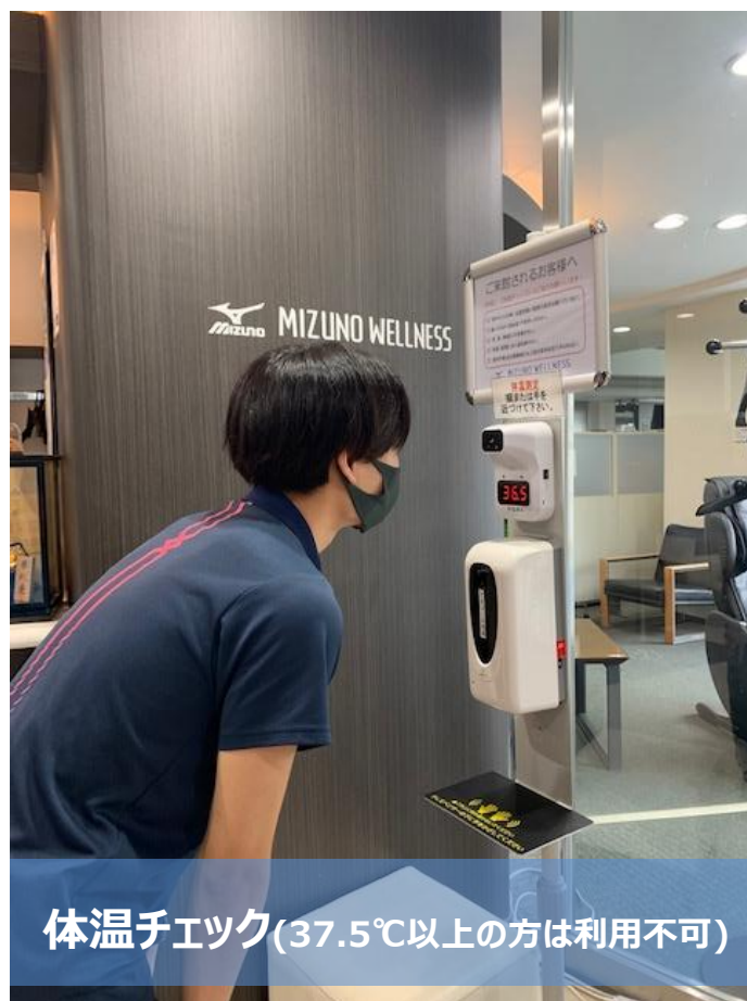
体温チェック(37.5℃以上の方は利用不可)