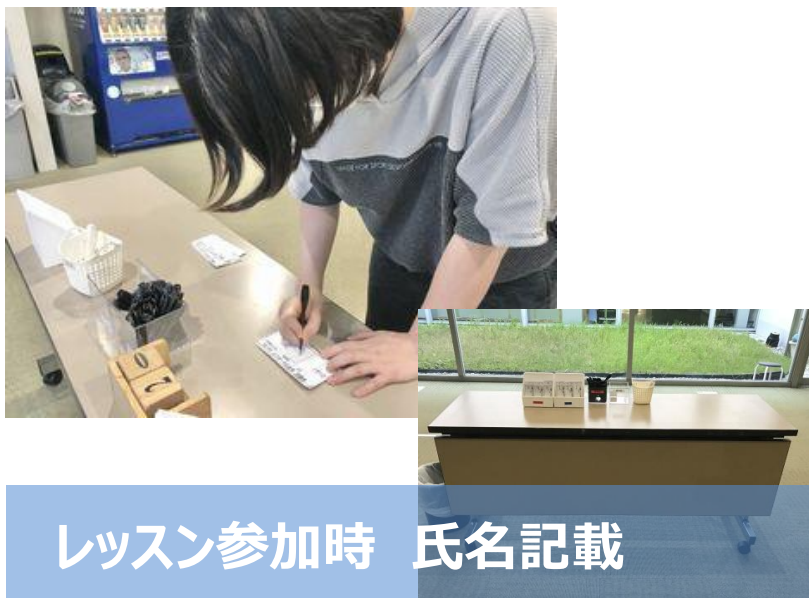
レッスン参加時 氏名記載

スタジオ 及び プールプログラムに参加される際は 、ロビーにて氏名記載をお願いいたします。