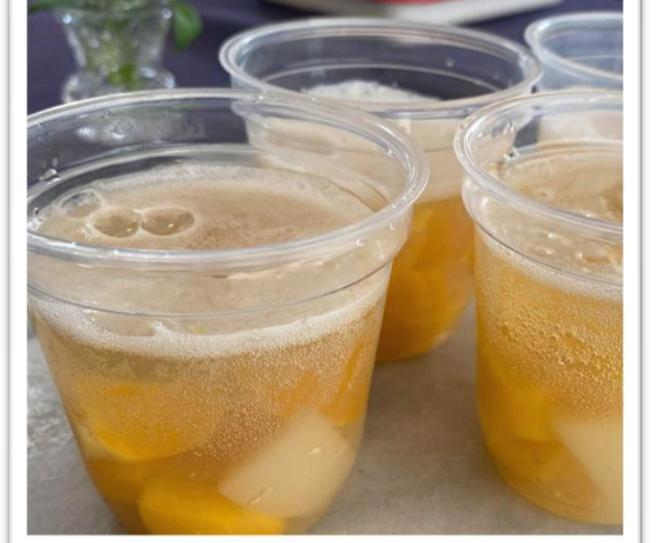
かんたん本格スイーツクッキング ジンジャーエールと 季節の果物の爽やかゼリー