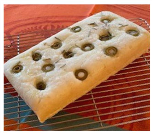
米粉100%で作るふわふわレシピ フォカッチャ