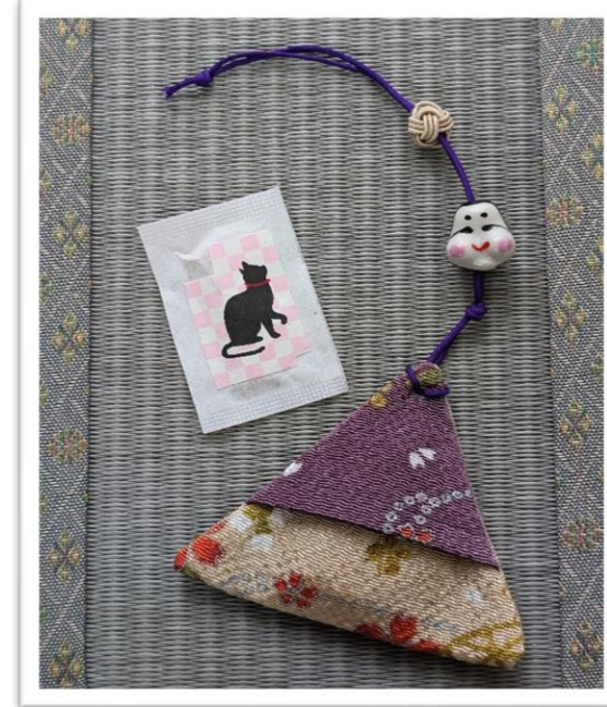
Let's study「お香」 浮世袋と文香