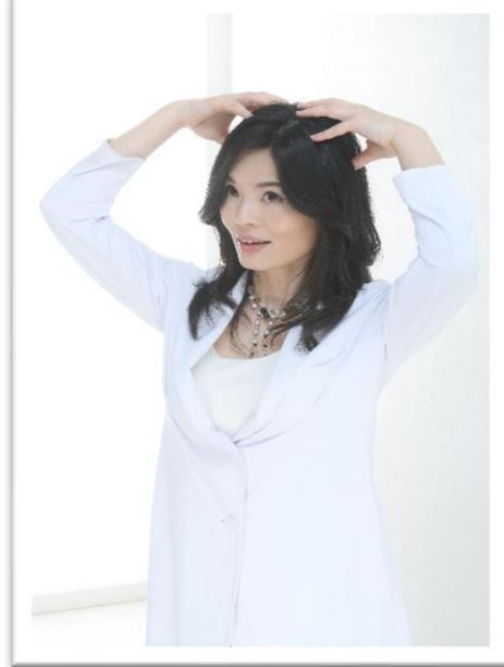
健康な体づくり講座 カラダの内側と外側から美しく 健やかになるヘッドケア