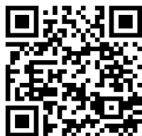
ホームページQRコード