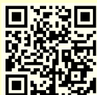
📅 教室スケジュール