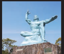
協力 広島平和記念資料館 長崎原爆資料館