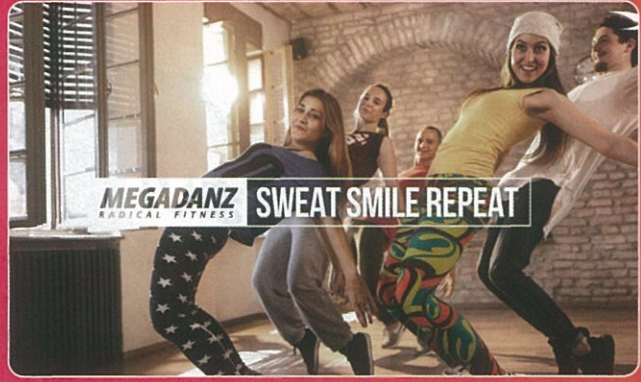
MEGADANZ メガダンス 世界のあらゆるダンスジャンルを楽しむことができるプログラム