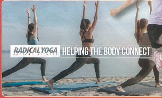
RADICAL YOGA ラディカル ヨガ 心地よいシンプルなヨガの動作で心身を整えるプログラム