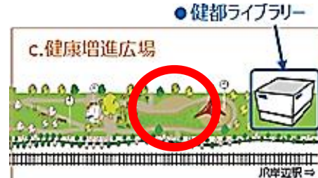
【健康遊具付近のあずまや】