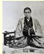
近藤勇 (霊山歴史館蔵)