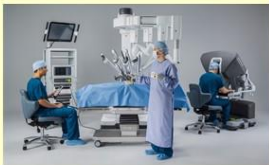
※ロボット手術イメージ

前立腺がんは男性に発生するがんの中で最も多いがんとなっており、長寿となっている昨今更に増加が見込まれるがんです。当院の泌尿器科では早期がんの根治治療を目指し平成29年3月からロボット支援下手術を開始しています。今回は「泌尿器科でのロボット手術を中心に治療について」あれこれお話しします。