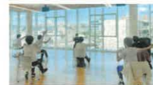
体験・途中回からの参加についてはご相談ください。

有酸素運動と筋力トレーニングを交互におこないます。ご自宅での運動も習慣化し、筋力や体力の維持・向上を目指しませんか? 1回目と12回目に体力測定をおこないます。