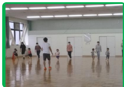
年少・年中・年長親子運動