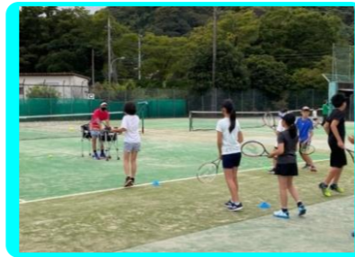
小学生硬式テニス