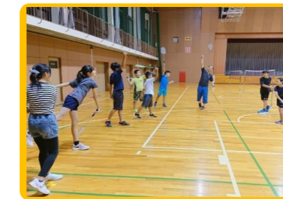
初級バドミントン