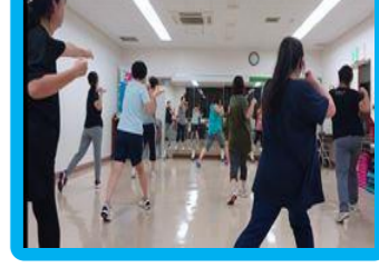
リズムエクササイズ