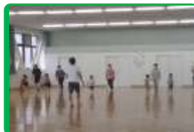
年少・年中・年長親子運動