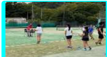
小学生硬式テニス