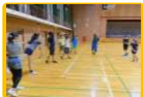
初級バドミントン