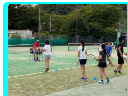
小学生硬式テニス