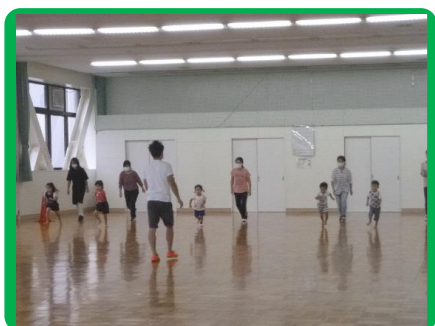
年少・年中・年長親子運動