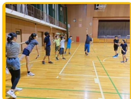
初級バドミントン