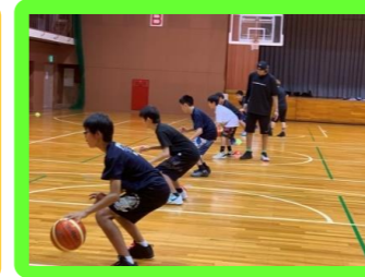
バスケットボール