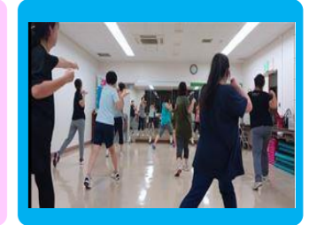
リズムボクシング