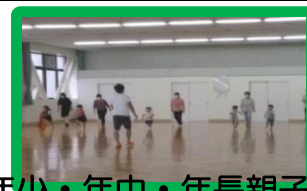
年少・年中・年長親子運動