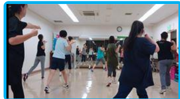
リズムボクシング