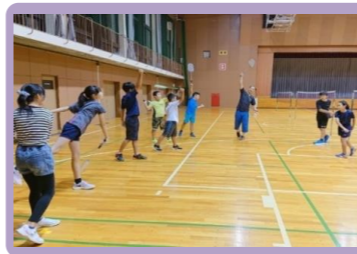
初級バドミントン