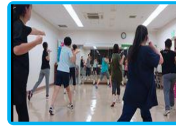
リズムボクソング