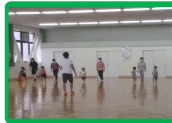
年少・年中・年長親子運動