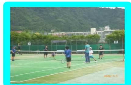
小学生硬式テニス