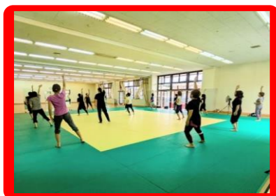
チャレンジフィットネス