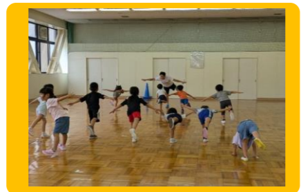
幼児運動能力向上教室