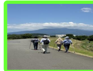
まちぶらルディック