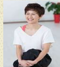
Tomoyo 先生 金曜日クラス ボディメイクヨガ

チャクラを意識したアーサナや呼吸法、気の巡り改善のチベット体操等を盛り込み、個人の体調に合わせてゆっくり進めていくクラスです。