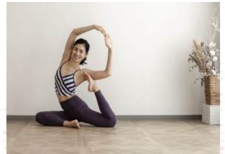
yuka インストラクター