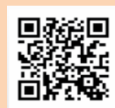
施設インスタグラム