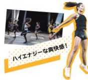
ハイエネルギーな爽快感！