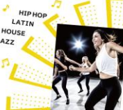
HIP HOP LATIN HOUSE JAZZ