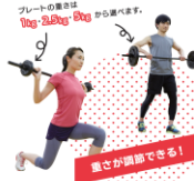
プレートの重さは Big-Big-Big から選べます。